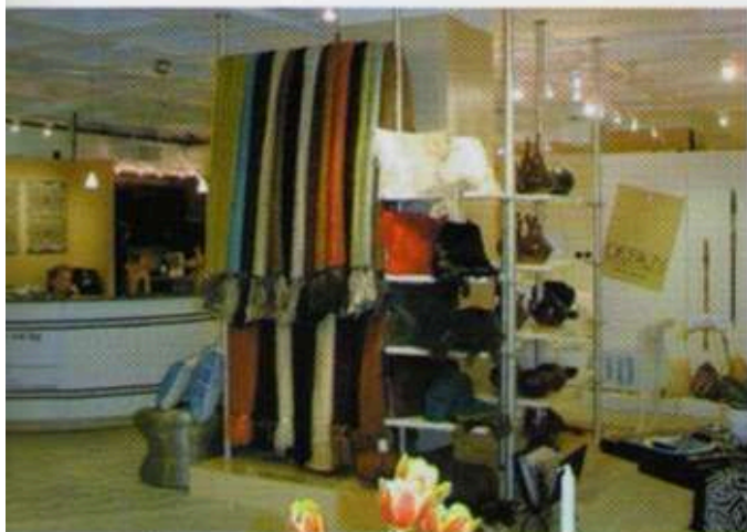
Left: MSA continued as a sponsoring member of SAITEC. The showroom in Atlanta.