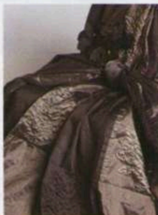
Fuggerhaus → 3.1 • B71