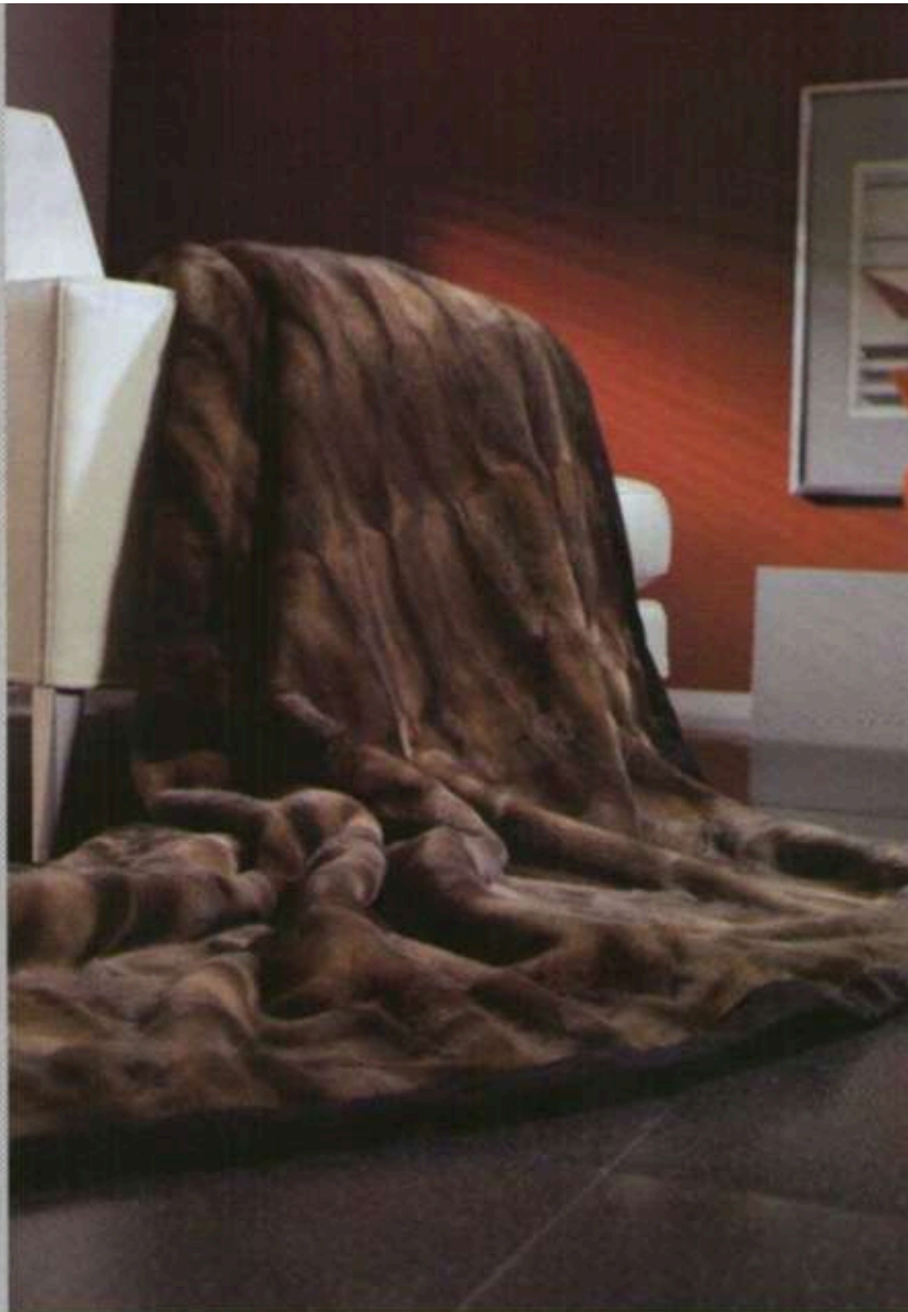
IBENA/Bugatti → 8.0 • D50