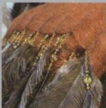
Abafazi → 3.1 • B09